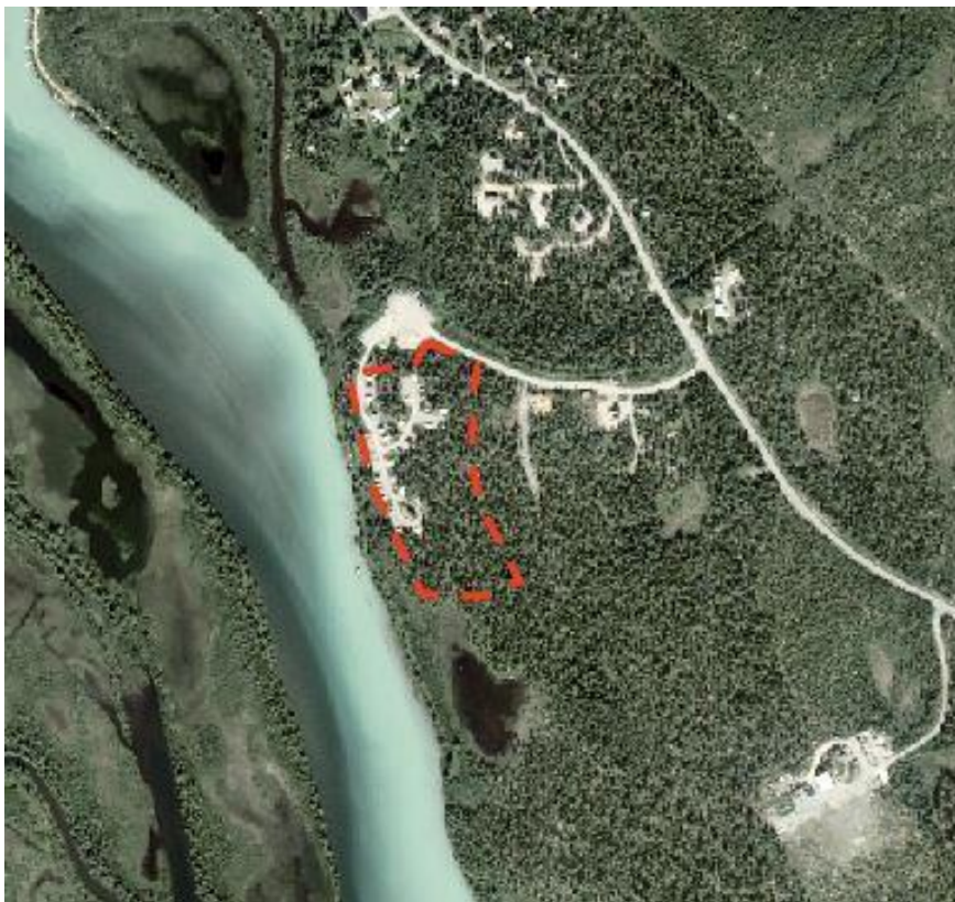
Karta visar planområdets läge i Kvikkjokk samt planområdets utbredning.