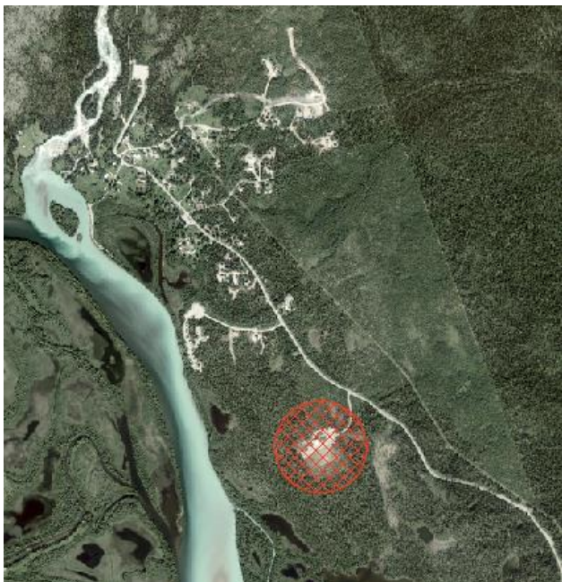
Karta visar planområde inom röd skrafferad cirkel.