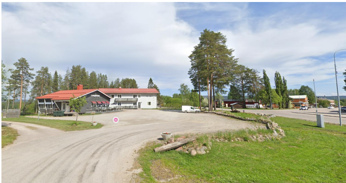
Figur 3 Planområdet med infart från Bodenvägen.

Planområdet nås via två grusade infarter som gränsar till Bodenvägen och Murjeksvägen. En stor del av markytan är hårdgjord med grus och används i dagsläget för parkering. Närmast Murjeksvägen utgörs marken av en gräsyta med fem tallar och ett mindre dike mot vägkanten. På grönytan samt längs parkeringen finns ett lågt upplagt stenstråk av natursten, största del av denna ligger utanför fastighetsgräns.