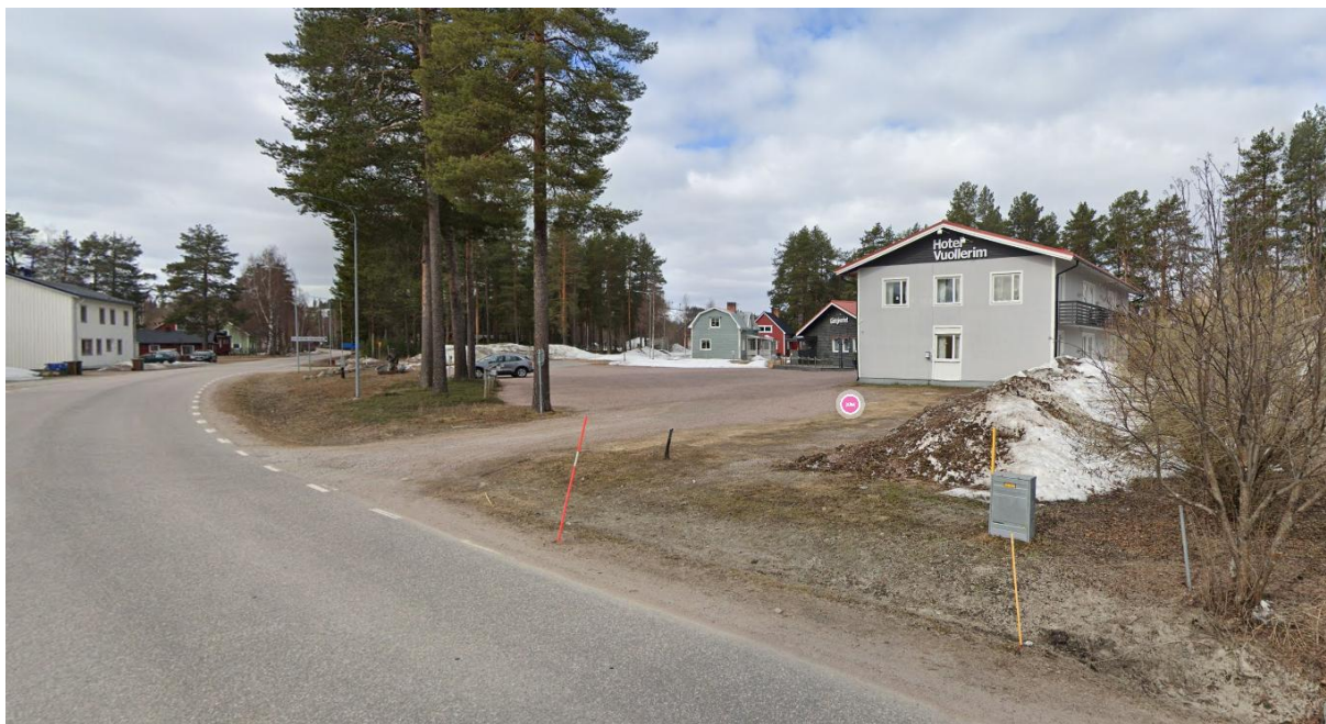
Figur 4 Planområdet med infart från Murjeksvägen.

Norr om planområdet finns ett skogsområde dominerat av tall med inslag av lövträd. Cirka 65 meter norr om planområdet är Vuollerimselet beläget. Marken inom planområdet är platt med plushöjd på +121 till +122. Utanför fastighetsgräns sluttar marken ner till Vuollerimselet med cirka 20 meters höjdskillnad.