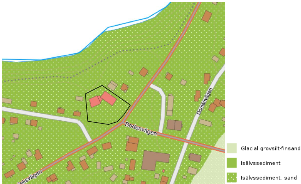
Figur 5 Jordartskartan från SGU. Planområdet är markerat med svart linje.

är fastmark. Jordarten har även en hög genomsläplighet, vilket ger goda förutsättning för infiltration av dagvatten.